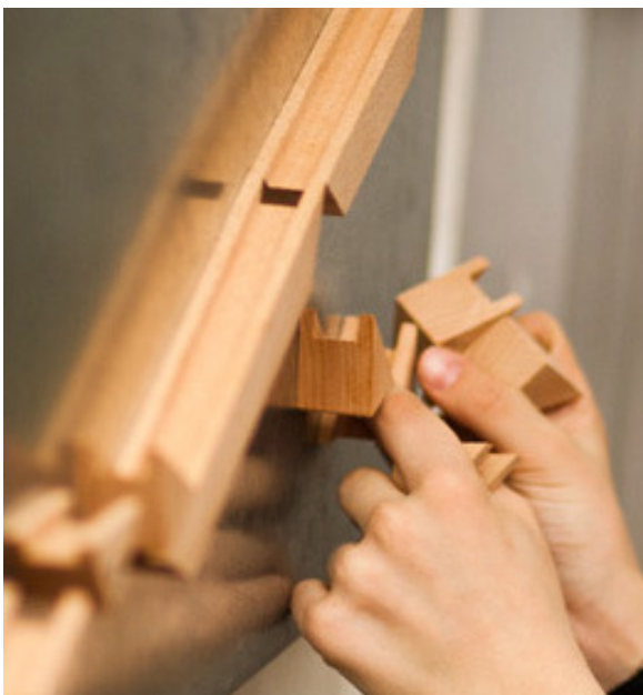
Kinder ab 5 Jahren können schon prima mit der Wandkugelbahn umgehen.