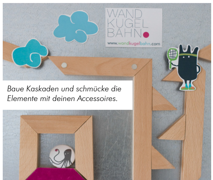
Baue Kaskaden und schmücke die Elemente mit deinen Accessoires.