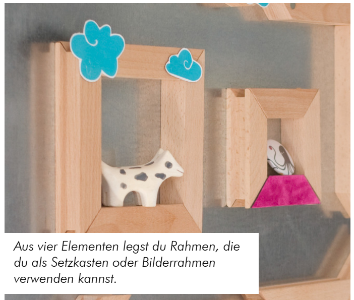
Aus vier Elementen legst du Rahmen, die du als Setzkasten oder Bilderrahmen verwenden kannst.

Mit diesem Spielekonzept möchten wir deine Synapsen zum Tanzen bringen. Out of the Box-Denken, Über-den-Tellerrand-Gucken und kreativ sein schon in jungen Jahren fördern. Wir hoffen, du hast Spaß!